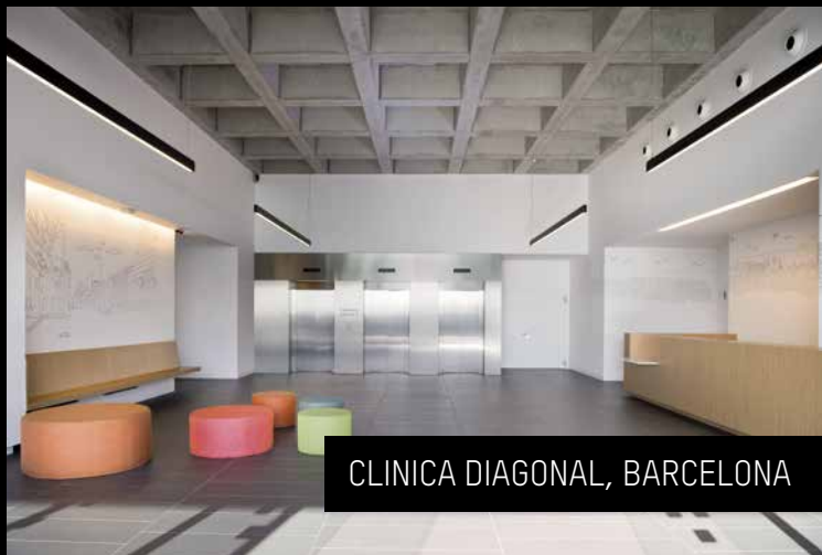
CLINICA DIAGONAL, BARCELONA