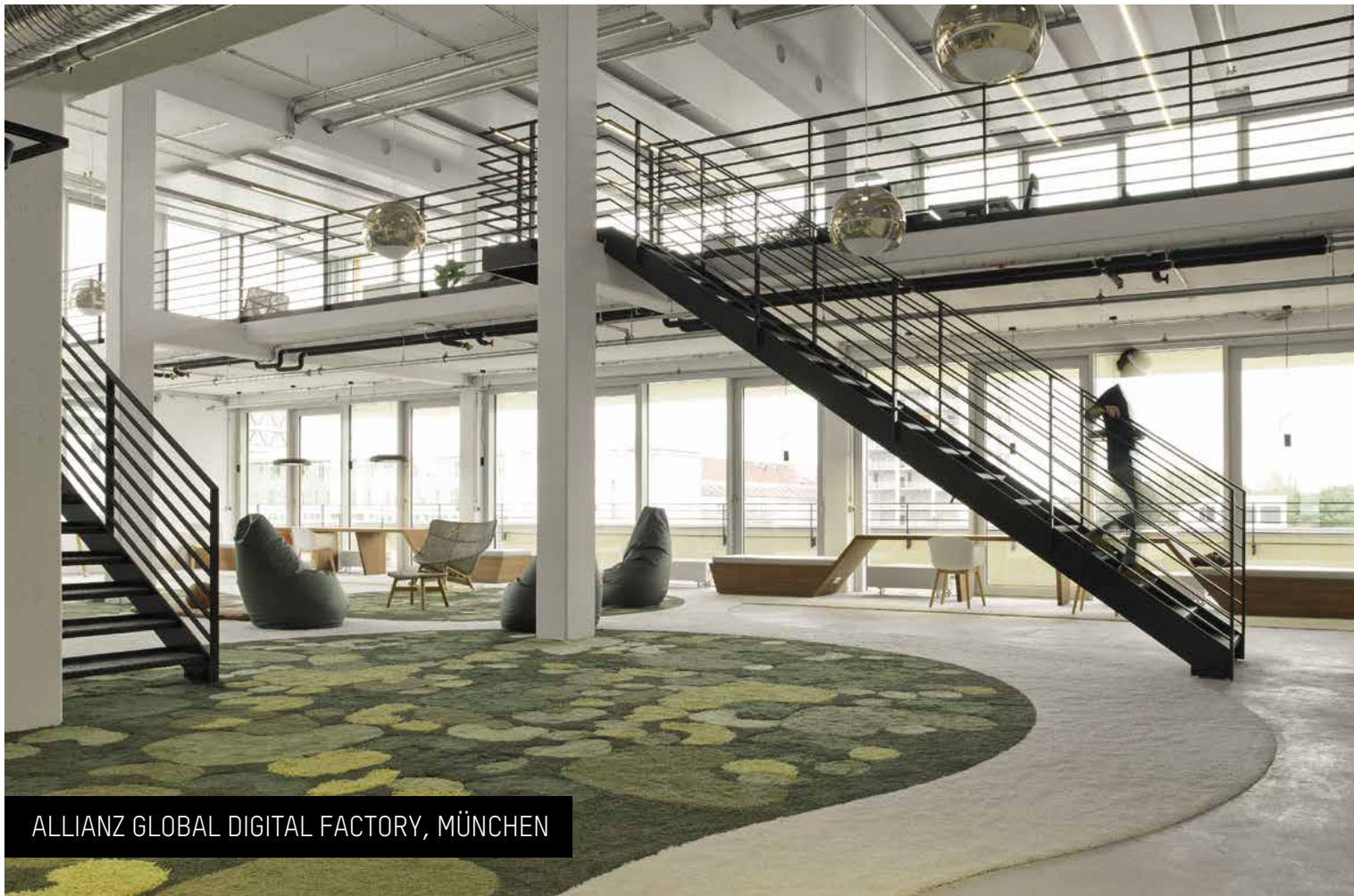
ALLIANZ GLOBAL DIGITAL FACTORY, MÜNCHEN