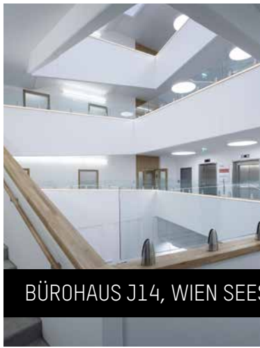
BÜROHAUS J14, WIEN SEESTADT